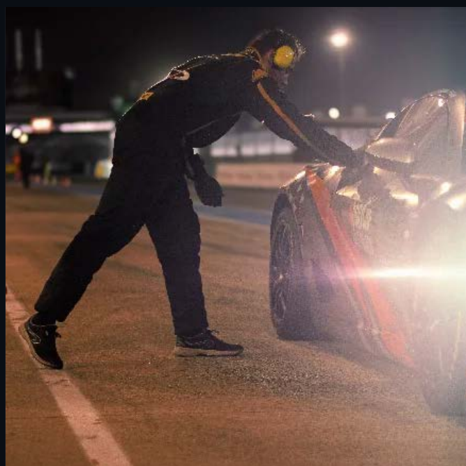
03 – DÉTAIL