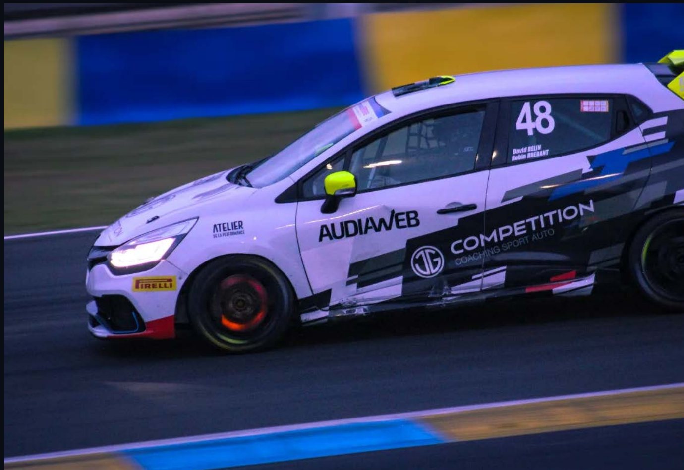
01 – HERO