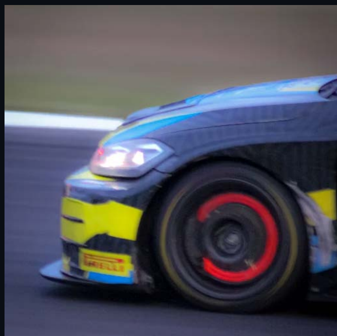
02 – DÉTAIL